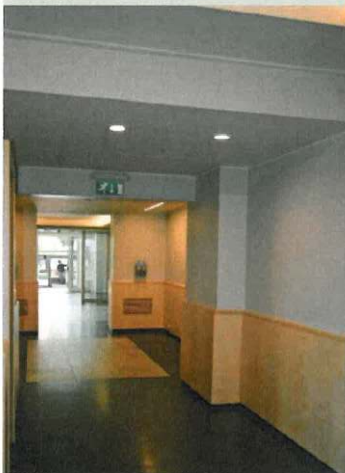
Un'altra immagine, con il posizionamento degli apparecchi