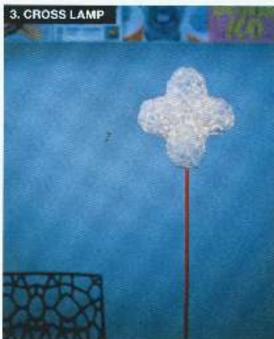
3. CROSS LAMP