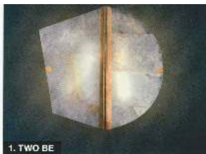
1. TWO BE